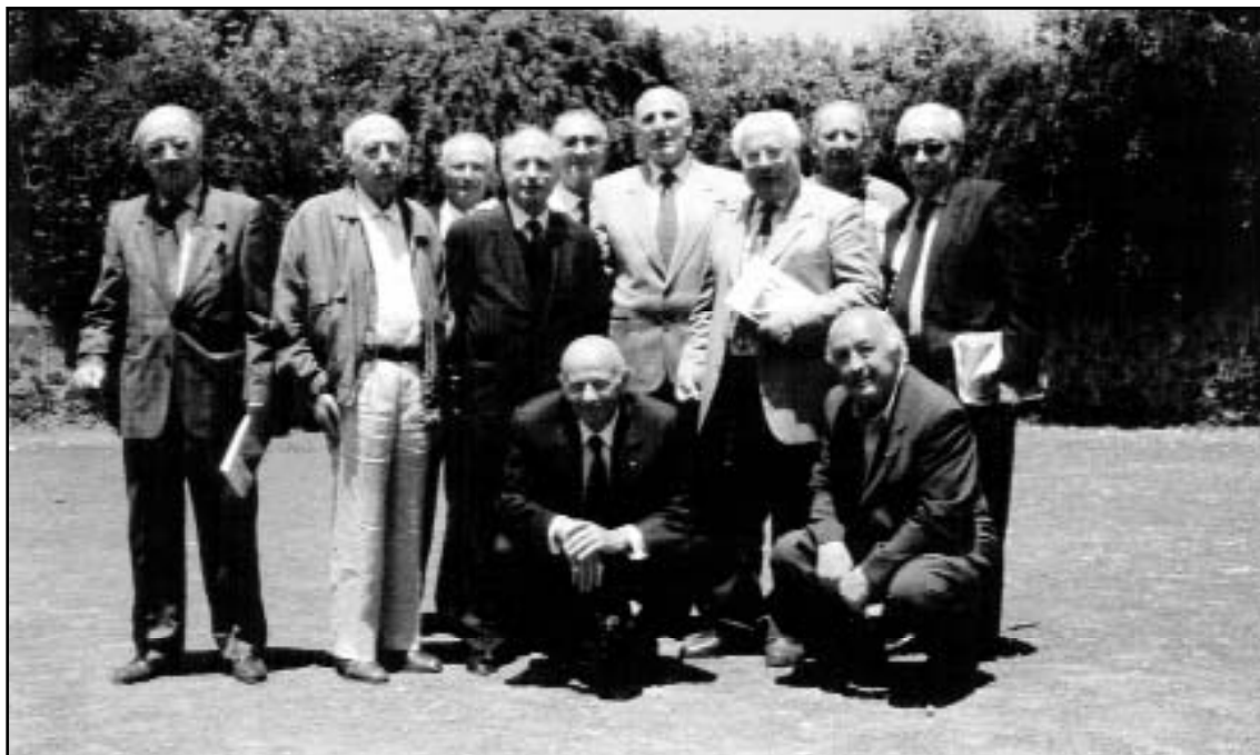
Convegno 2000: un gruppo di "maturi" del 1953