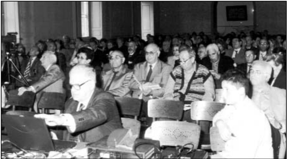
Convegno ex-allievi 2002 - Due momenti dell'Assemblea