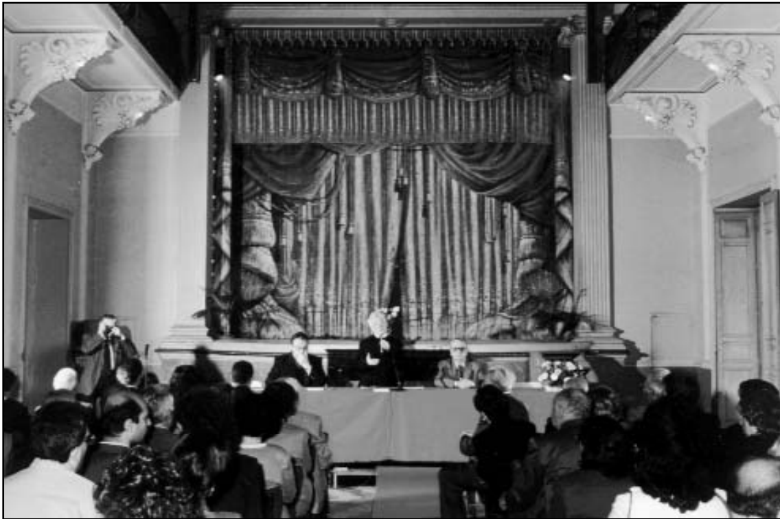
Convegno ex-allievi 2001 - Un momento dell'Assemblea

Novità deliziosa di questi Oratori festivi era il “discorso del Pupo” ( del Putto ): un bimbo precedentemente ammaestrato faceva un discorsino alla folla degli adulti, diffondendo nella comitiva una nota di grazia angelica.