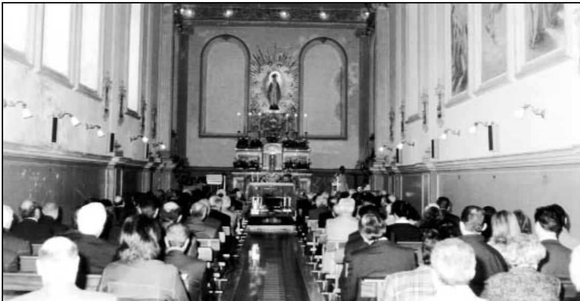
Convegno ex-Allievi - Celebrazione Eucaristica nella Cappella dell'Istituto

Da oggi non faremo più parte degli alunni del “San Michele” ma continueremo a far parte della grande famiglia del nostro Istituto con l’Associazione ex-Alunni.